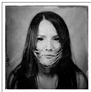
Obraz 2018 1/1 médium, formát cena